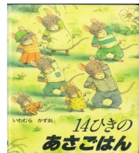
「14ひきのあさごはん」 作：いわむら かずお 出版社：童心社