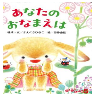
「あなたのおなまえは」 構成・文：えぐさ ひろこ 絵：田中 由佳 出版社：フレーベル館