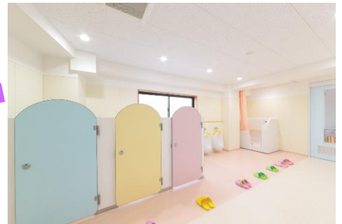
トイレ(幼児) 明るく快適なトイレ、シャワーもあります。