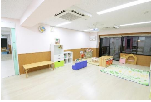
ももの部屋(乳児室) 南側、西側に窓があり明るく景色のよい部屋です。南側のベランダより、避難滑り台に避難することができます。