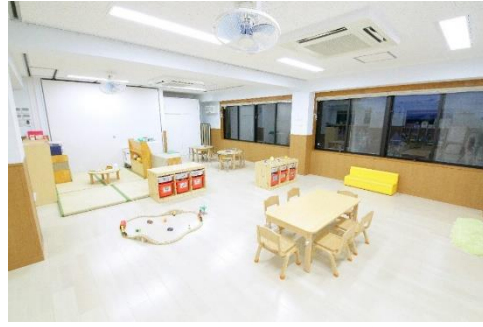
きみどりの部屋(幼児室) ままごと 電車 ラキュー 子どもたちが好きな遊びを選びます。「先生、みてみて」と南側、北側に窓がある明るい部屋に元気な声が聞こえます。