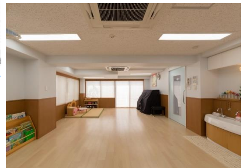
みずいろの部屋(幼児室) 南側、西側、東側に窓があり、園庭の桜、パールブリッジがよく見えます。